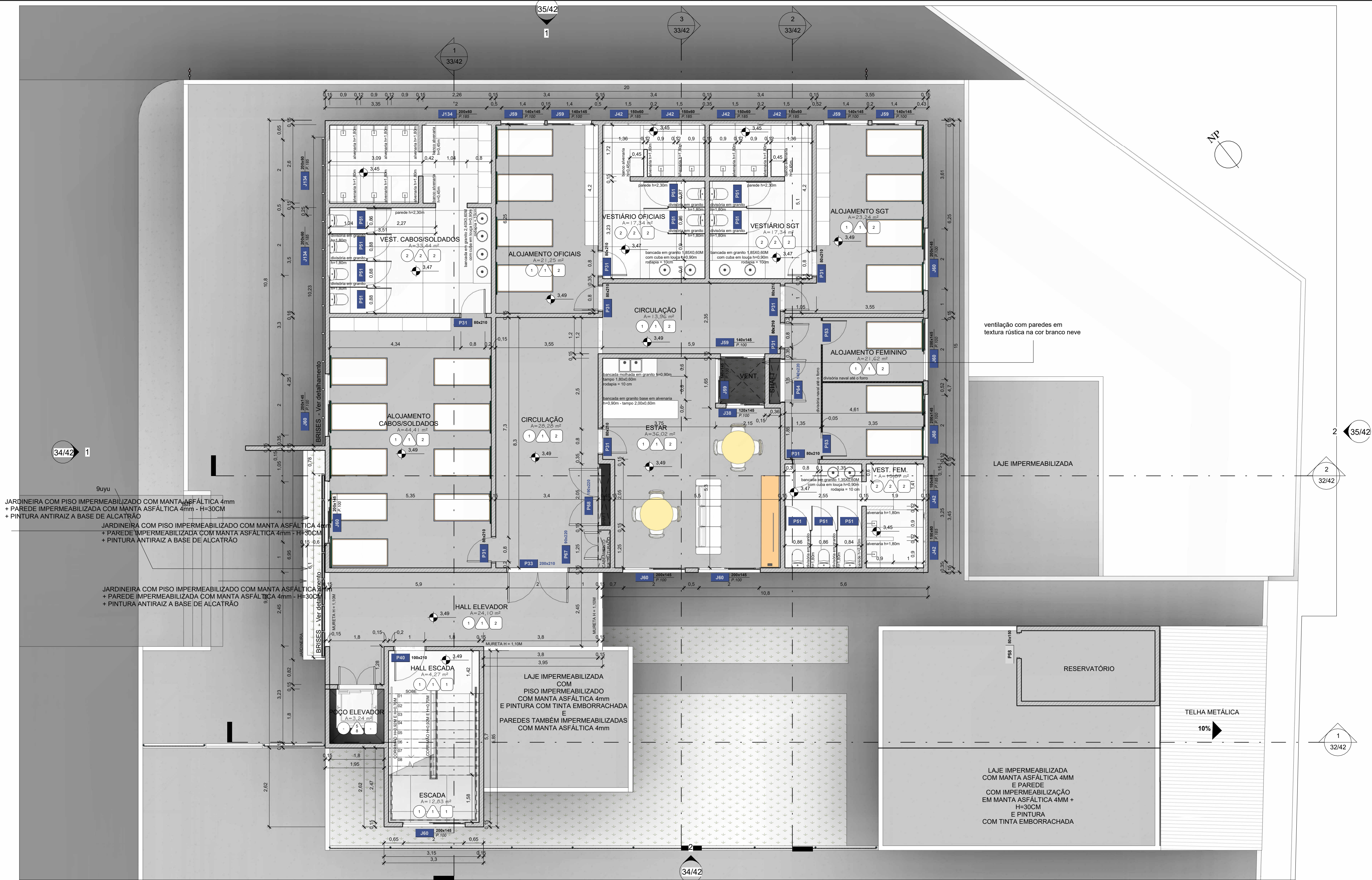
1 BPCAATINGA - PLANTA BAIXA - 1º ANDAR ESCALA 1 : 75